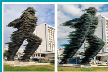
Nettoyage de la statue Dromeas